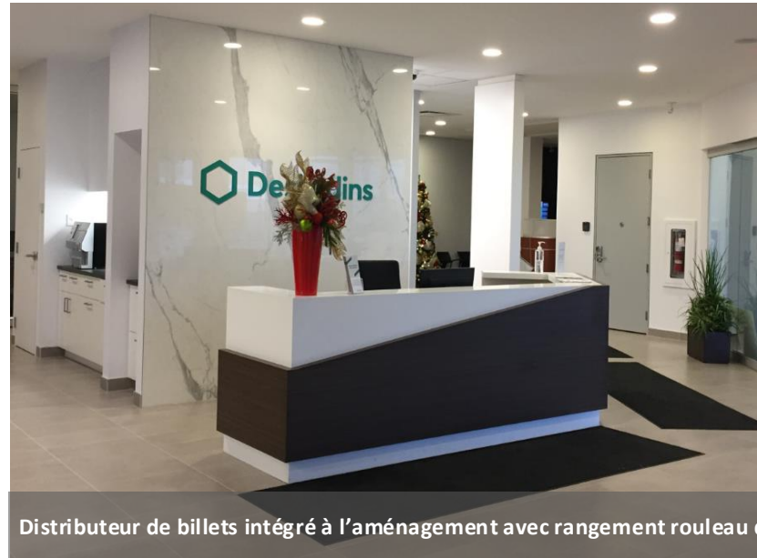
Distributeur de billets intégré à l'aménagement avec rangement rouleau de papier à proximité de l'accueil