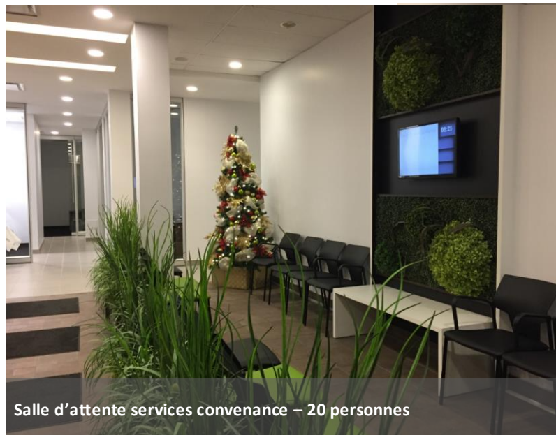
Salle d'attente services convenance – 20 personnes